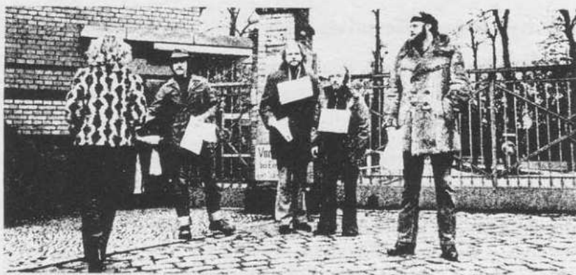
irrenoffensive-leden in actie bij de kliniek in reinickendorf

ook persoonlijke zaken. We letten er bij elkaar op dat we niet weer zo normaal worden dat we weer in een inrichting terechtkomen. Verder runnen we nog een winkeltje dat fungeert als klachten- en informatieburo. Er wordt voorlichting gegeven over de gevaren van psychofarmaka, over wat er gebeurt bij opname in een inrichting, en over de juridiese aspecten. Dit doen we samen met een groep kritiese werkers.